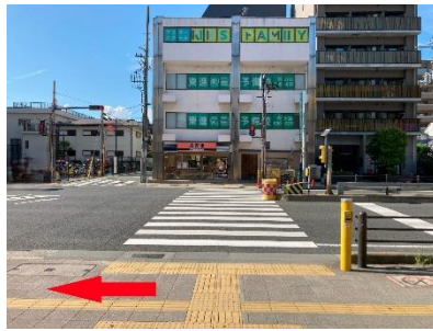
⑤左に向かって進みます (右にはイオンタウンがあります)