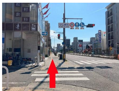
⑥しばらく直進です