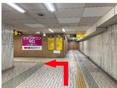
②点字ブロックに沿って左にまがります