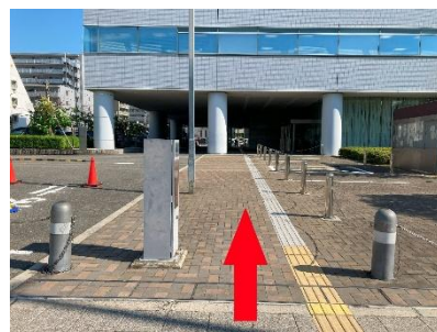
⑧守口市役所に沿って直進し、 点字ブロックに沿って左にまがって入ります