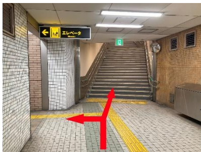
③階段またはエレベーターで地上に出ます