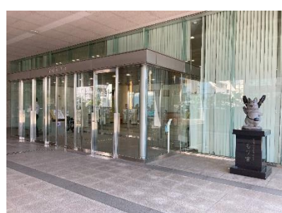
⑨守口市役所に着きます