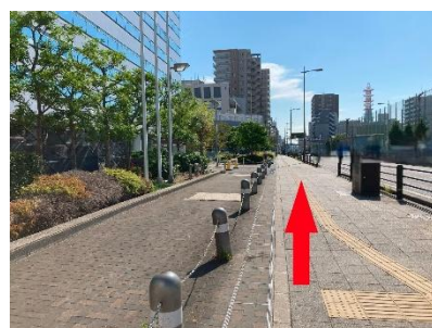
⑦左手に守口市役所が見えてきます